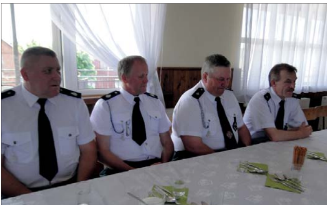
Delegaci z OSP Kaczorowy i Bogucin