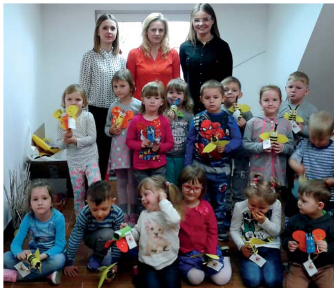
Po zajęciach w domu kultury