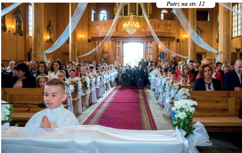
Patrz na str. 12