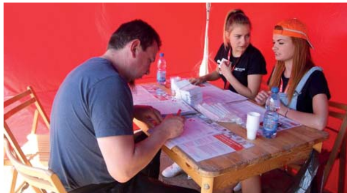
Rejestracja dawców szpiku kostnego