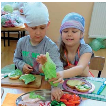
Przygotowywanie śniadania było dużą frajdą dla dzieci

Pierwszoklasiści ze Szkoły Podstawowej w Krajkowie uczyli się o zawartości witamin w warzywach i owocach i o znaczeniu ich dla organizmu człowieka. W związku z tym 5 maja zrobili wspólnie zdrowe śniadanie: kanapki z pomidorami, ogórkami, rzodkiewką, sałatą i wędliną. Przygotowali się bardzo starannie, założyli fartuszki, nakryli głowy i dopiero wzięli się do pracy. Bułeczki były kolorowe, ładne i szybko zniknęły z talerzy dzieci.