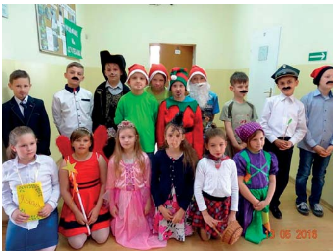
Wykonawcy części artystycznej