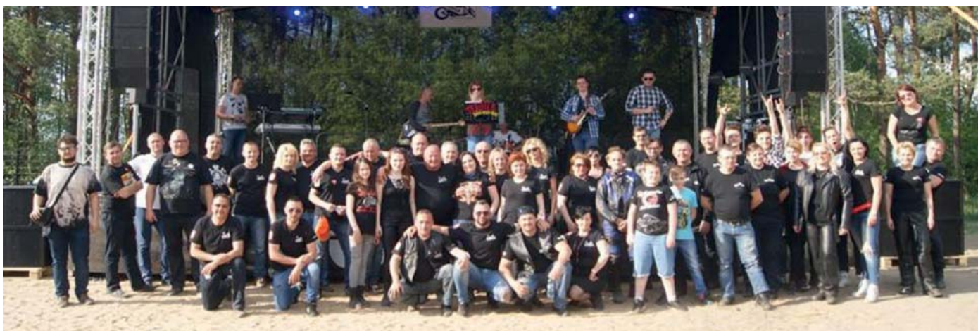
...Nie mogło zabraknąć pamiątkowej fotografii