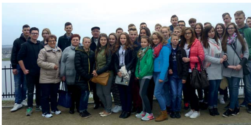
Pamiątkowa fotografia uczestników pielgrzymki