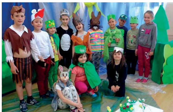
Wykonawcy przedstawienia „Wiosna, wiosna”

Uczniowie kl. I ze Szkoły Podstawowej w Krajkowie zapatrzeni w uroki przyrody przygotowali przedstawienie „Wiosna, wiosna”. Dzieci nauczyły się piosenki i przydzielonych ról. Z rodzicami przygotowały kostiumy