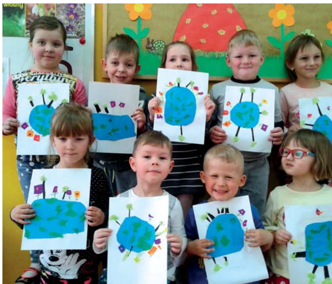
Dzieci ze swoimi pracami