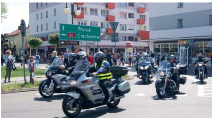
Parada przez miasto

Podczas pikniku integracyjnego był czas nie tylko na zabawę. Prowadzona była bowiem rejestracja dawców szpiku kostnego. Zarejestrowały się 24 osoby.