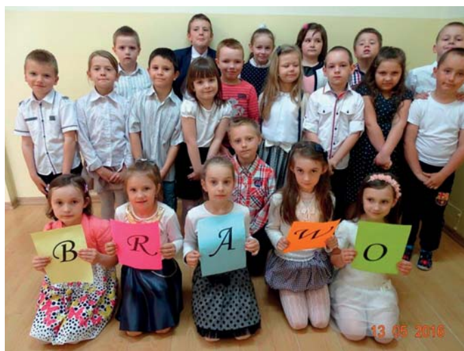
Nowi czytelnicy biblioteki szkolnej w Krajkowie