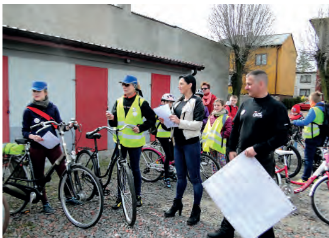
Odprawa przez startem