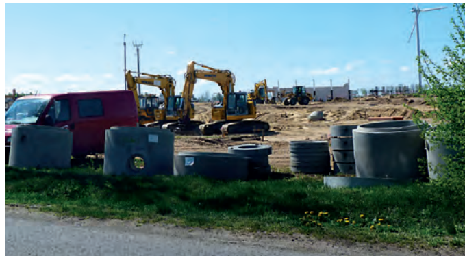
Budowa zakładu produkcyjnego Alfa PVC w Witkowie