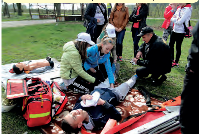
Punkt udzielania pierwszej pomocy