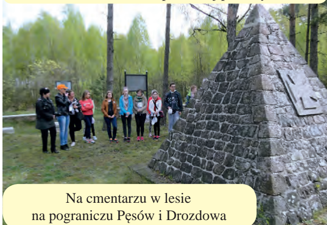
Na cmentarzu w lesie na pograniczu Pęśów i Drozdowa