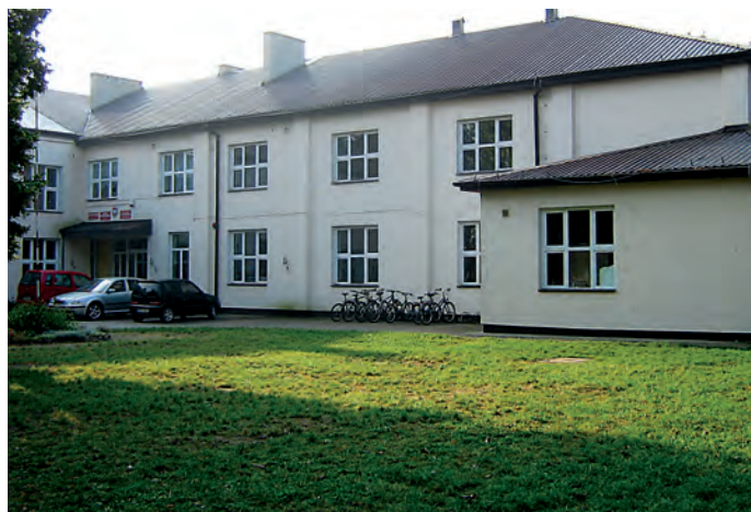
Szkoła w Kozebrodach