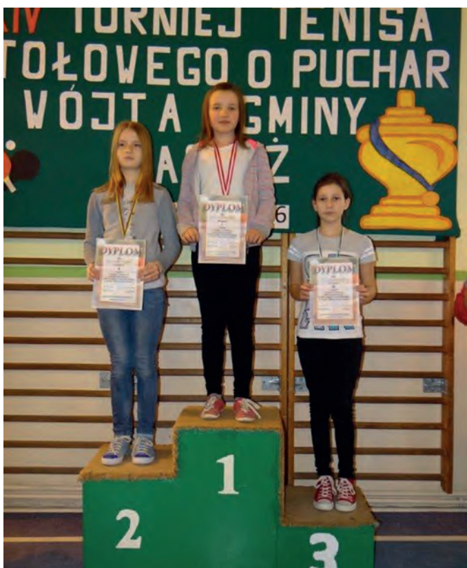
Najprzyjemniejszy moment zawodów