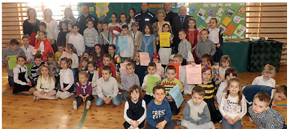
Uczestnicy uroczystej akademii