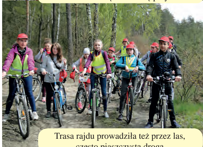
Trasa rajdu prowadziła też przez las, często piaszczystą drogą