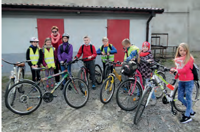
Gotowi do wyruszenia na trasę