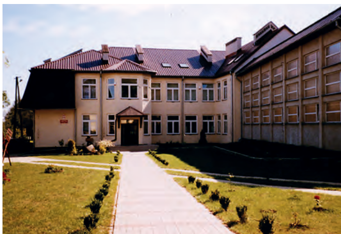
Szkoła w Uniecku

Gmina zapewni bezpłatny dowóz uczniów likwidowanej szkoły i opiekę w czasie przewozu do Szkoły Podstawowej w Uniecku. Zostanie zaangażowany dodatkowy autobus, co skróci czas oczekiwania dzieci na odjazd do domu. Odległość między szkołami w Kodłutowie i Uniecku jest niezbyt duża i wynosi 5 km. Połowa miejscowości należących do obwodu Filii Szkoły Podstawowej w Kodłutowie leży w porównywalnej odległości od Uniecka i Kodłutowa. Dojazd do szkoły będzie się odbywał w godzinach 7 30 – wyjazd z Kodłutowa, 7 50 – przyjazd do Uniecka. Powrót do domu – będą dwa kursy: pierwszy dla dzieci młodszych, wyjazd z Uniecka 12 35 – przyjazd do Kodłutowa 12 55 , drugi dla uczniów kl. IV-VI odpowiednio 14 20 – wyjazd, 14 40 – przyjazd do domu.