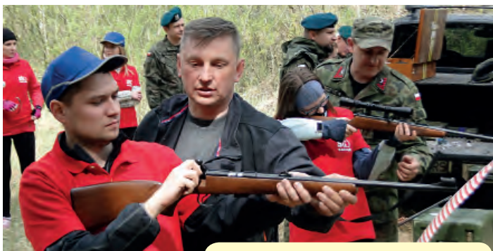
A teraz strzelanie