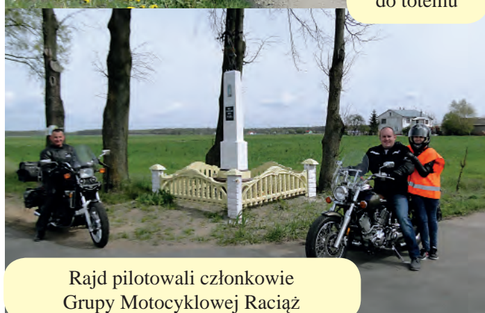
Rajd pilotowali członkowie Grupy Motocyklowej Raciąż