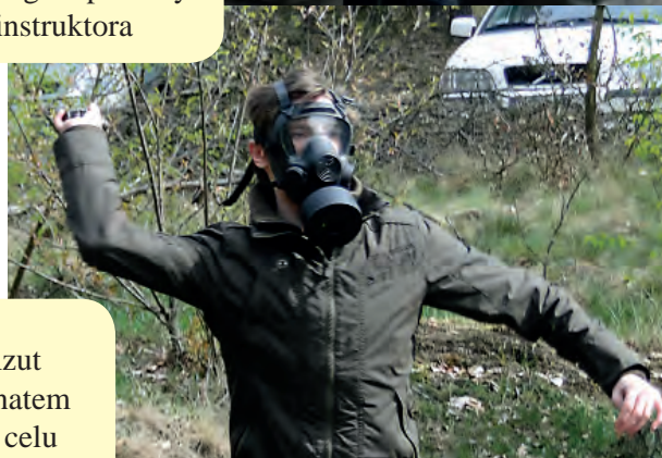
Rzut granatem do celu