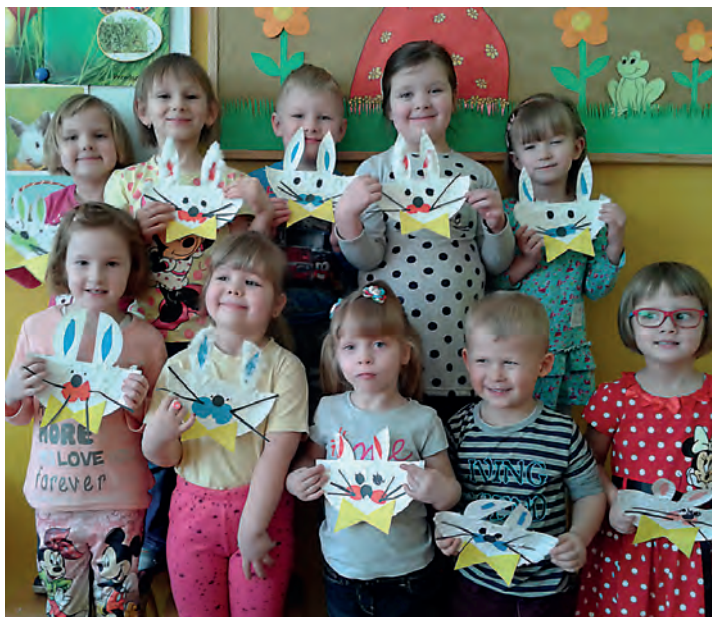
Dzieci ze swoimi pracami