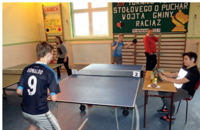
Przy stołach tenisowych rywalizowali uczniowie z 9 szkół