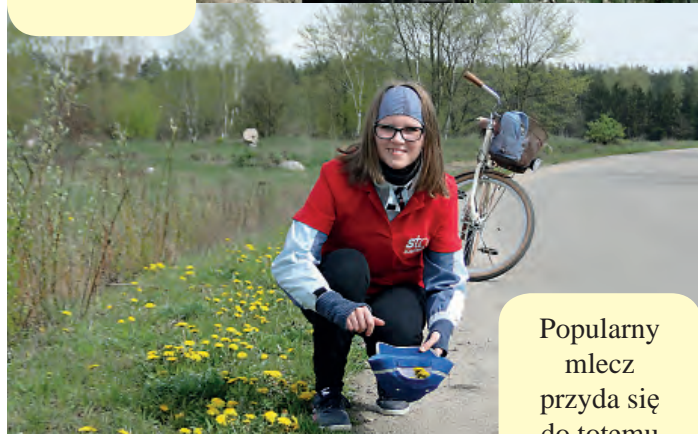
Popularny mlecz przyda się do totemu