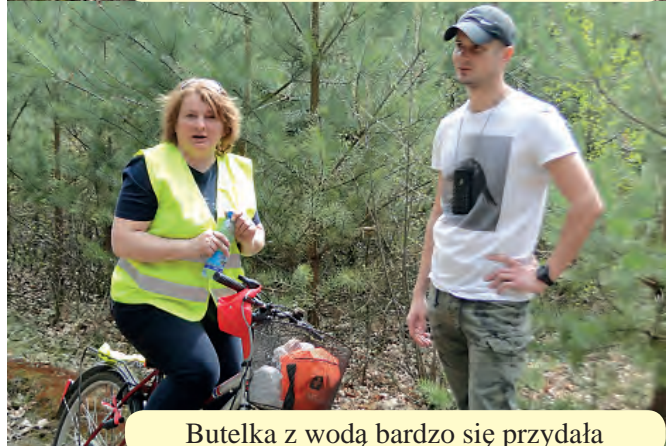
Butelka z wodą bardzo się przydała