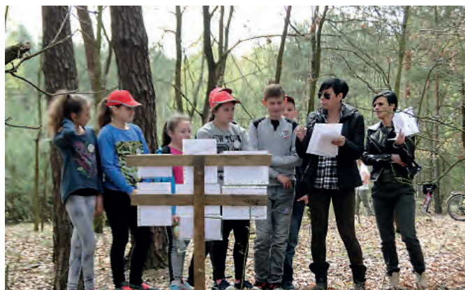
Krótką lekcją przy okopach