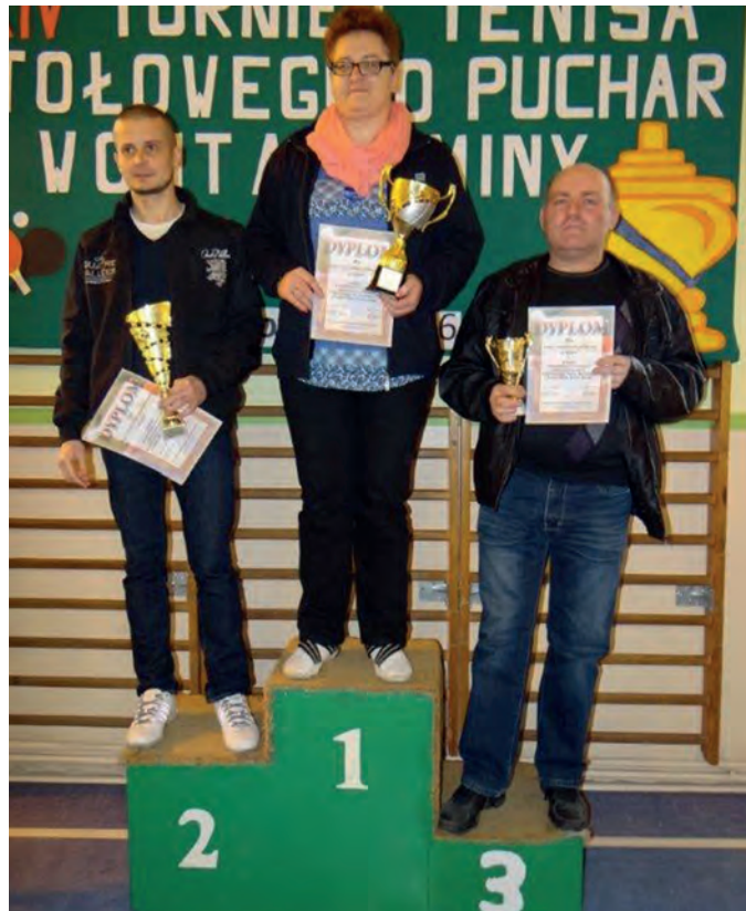
Na podium opiekunowie najlepszych reprezentacji szkół podstawowych