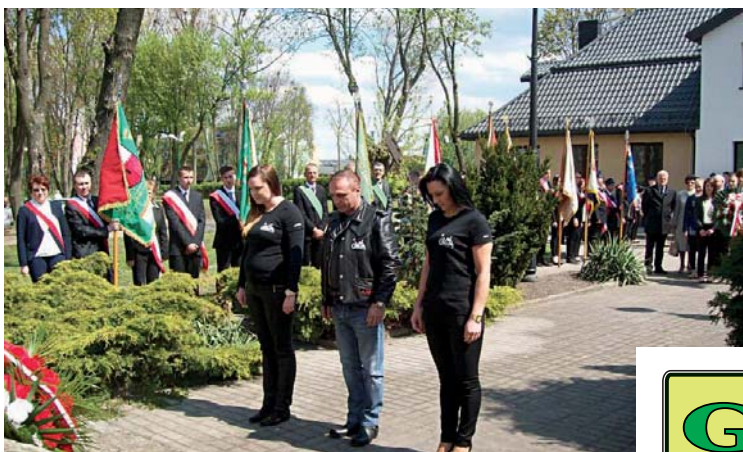
Podczas obchodów 224. rocznicy uchwalenia Konstytucji 3 Maja