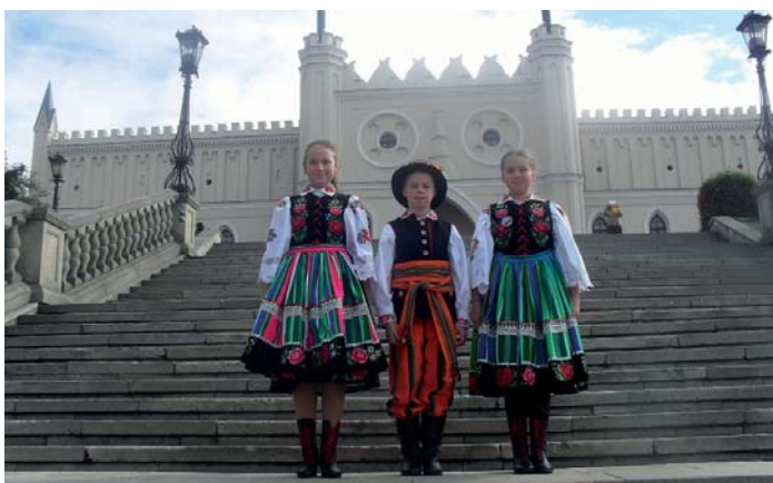
Uczniowie SP w Koziebrodach – uczestnicy zlotu

Beata Bońkowska ZS w Koziebrodach