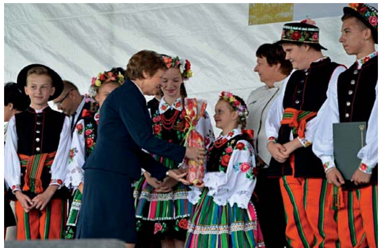
Członkowie zespołu Krajkowiacy odbierają nagrodę za trzecie miejsce

Pierwsze miejsce w kategorii muzyczno-tanecznej zdobył zespół z Sannik, miejsce drugie Ludowy Zespół Artystyczny „Kasztelanka” z Sierpca, a miejsce trzecie Szkolny Zespół Taneczny Krajkowiacy. Gratulujemy.