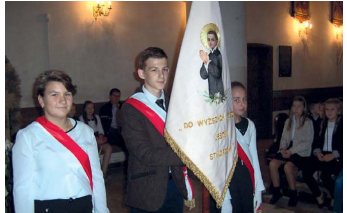
Poczet sztandarowy podczas uroczystości w kościele

Dla uczniów klas IV-VI i uczniów gimnazjum zorganizowany został międzyklasowy konkurs. Jego uczestnicy mieli okazję wykazać się swoją wiedzą i umiejętnościami z różnych dziedzin. Odgadywano np. ile guzików jest przyszytych do sutanny księdza, jakie zwierzęta zabrał Abraham do arki, jak nazywa się najdłuższa rzeka w Polsce. Rozpoznawano też przyprawy kuchenne oraz budowano na czas wieżę z zapalek. Najmłodszy uczniowie przygotowywali w klasach plakaty związane z życiem św. Stanisława Kostki. Dodatkowo każda klasa mogła otrzymać punkty za galowy strój szkolny.