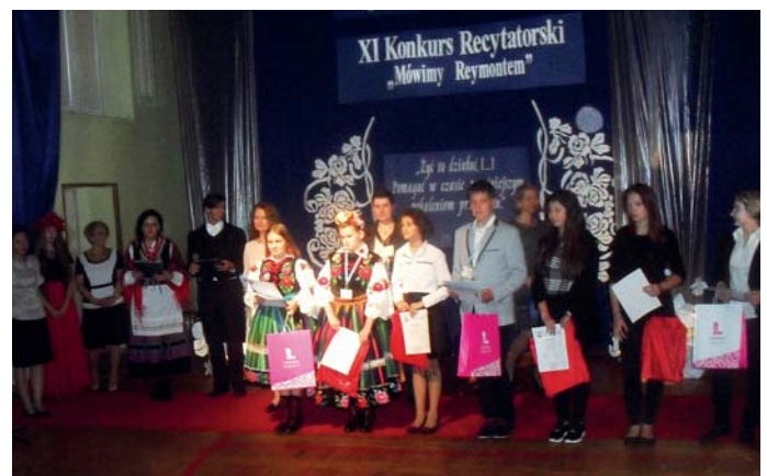
Nagrodzeni w konkursie „Mówimy Reymontem”