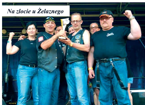
Na zlocie u Żelaznego