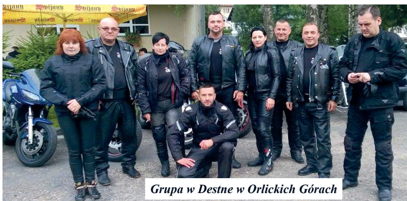
Grupa w Destne w Orlickich Górach