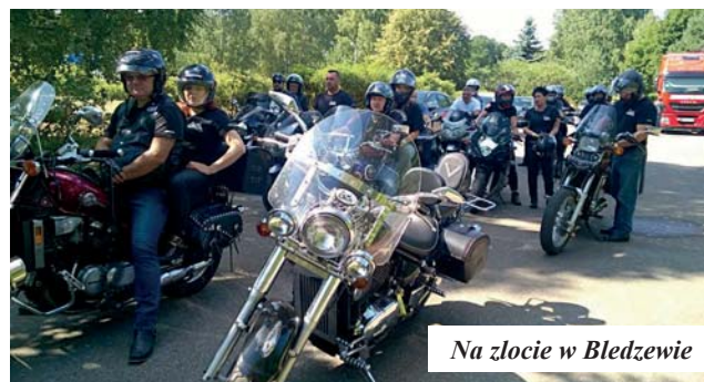
Na zlocie w Bledzewie