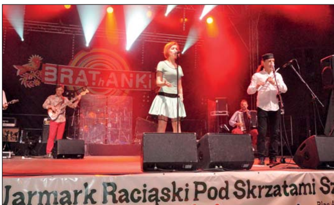
Gwiazdą imprezy był zespół Brathanki