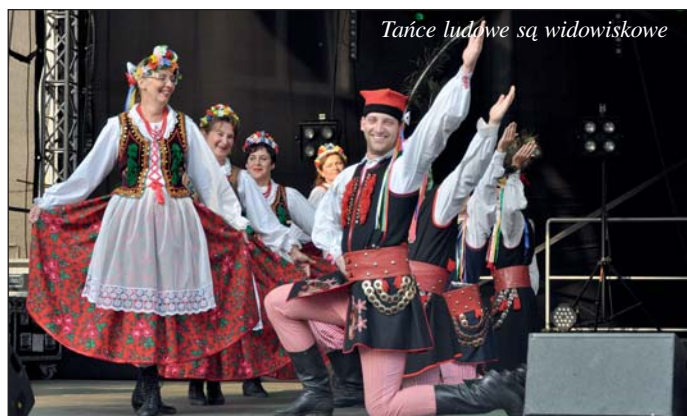
Tańce ludowe są widowiskowe