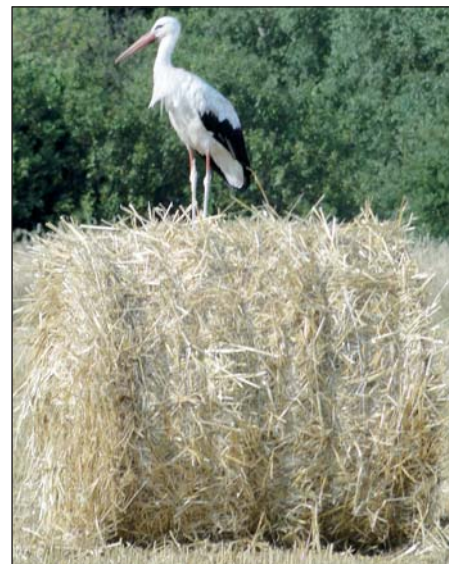
Bela słomy okazała się doskonałym punktem obserwacyjnym

– W moim gospodarstwie potrwają jeszcze z tydzień. Do zebrania mamy zboże z 35 hektarów, a to i tak mało. Jeszcze dokupuję. Liczące sto sztuk stado bydła trzeba wykarmić – dodaje gospodarz i zjeżdża z pola z przyczepami wypełnionymi belami słomy.