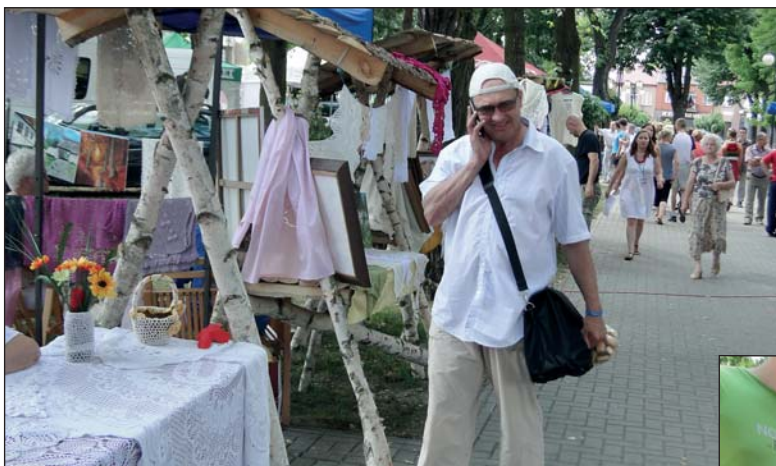
Ten pan zdaje się telefonicznie namawiać znajomych, żeby przybywali do „małego” parku, bo warto