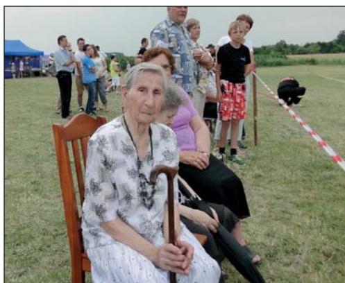
Kilka tygodni temu spotkaliśmy jubilatkę na zawodach strażackich w Jeżewie Wesel

Bardzo lubi kwiaty, szczególnie storczyki, ale nie tylko. Także te ogrodowe. Sama o nie dba, pielęgnuje je.