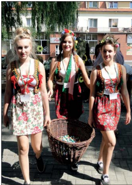
Dziewczyny w barwnych strojach częstowały cukierkami