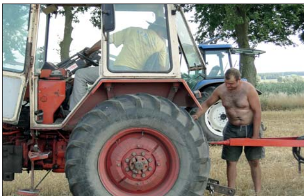
Nie ma to jak harmonijna współpraca ojca i syna