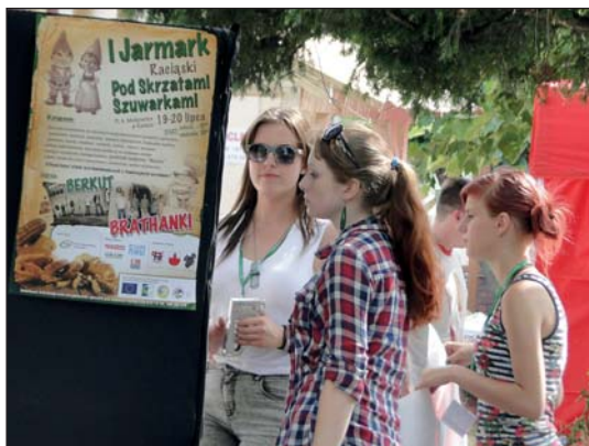
Dziewczyny zastanawiają się chyba na tym, które występy warto obejrzeć