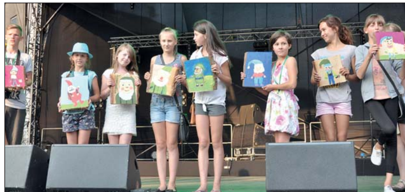
Uczestnicy konkursu plastycznego na portret skrzata Szuwarka prezentują swoje prace