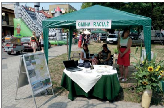
Nie mogło zabraknąć stoiska gminy Raciąż