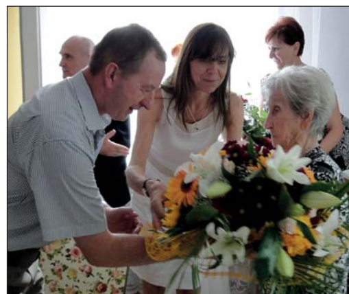
Życzenia i kwiaty od przedstawicieli MUW...