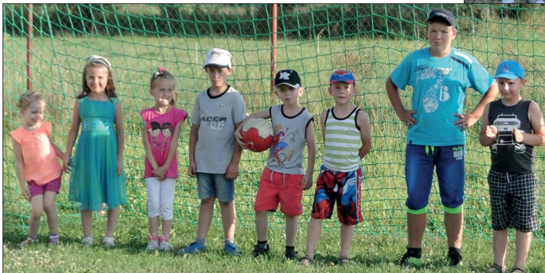
Nie obyło się bez pamiątkowego zdjęcia drużyny mieszanej