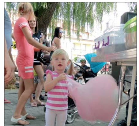
Na jarmarku nie mogło zabraknąć waty cukrowej, którą uwielbiają dzieci