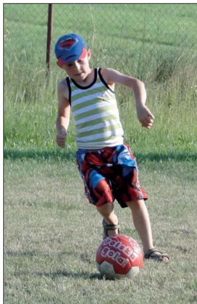
Piłkarski narybek nie tracił czasu i trenował z zapalem