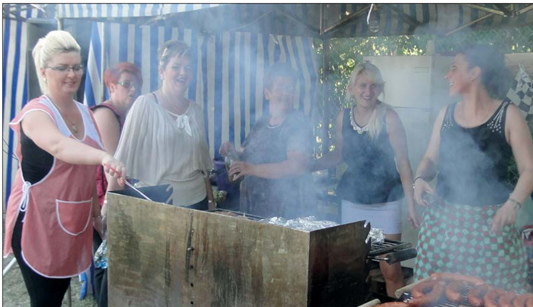
Panie zadbały o strawę