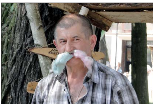
Temu panu wata cukrowa posłużyła do zupełnie innych celów niż konsumpcja