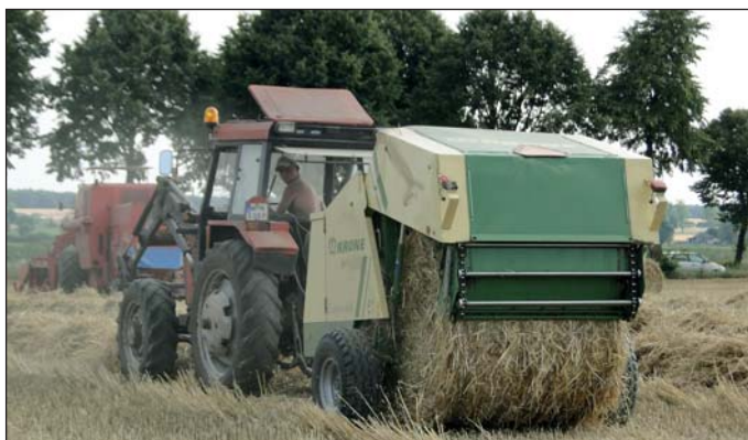
Maszyna co i raz „wypływała” związane bele

Choć było już po południu, upał wciąż dawał się we znaki. Słoneczna pogoda sprzyjała żniwom, ale rolnicy musieli wylać wiele potu, aby zebrać zboże, mimo że ów zbiór teraz jest niemal w pełni zmechanizowany.