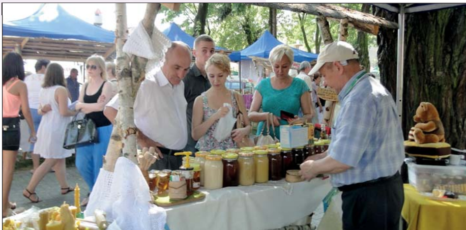
Nie od dziś wiadomo, że miód to samo zdrowie

Piekarnia rodziny Wiejskich to firma znana i uznana