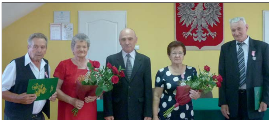
Uczestnicy jubileuszowej uroczystości