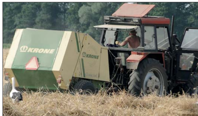
Bociany nic sobie nie robiły z warkotu silnika