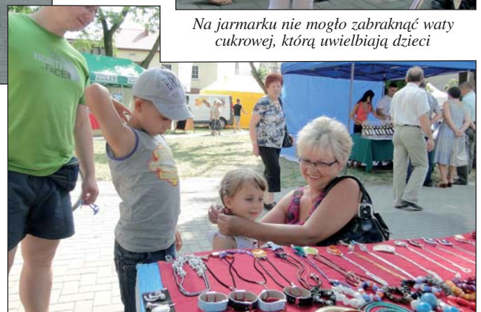
Niektóre dzieci, zanim trafiły na stoisko z watą cukrową, wpięrow się przystroić