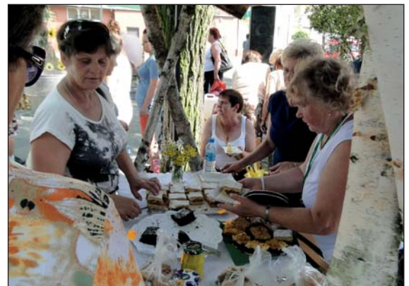
Dużym powodzeniem cieszyły się domowe ciasta