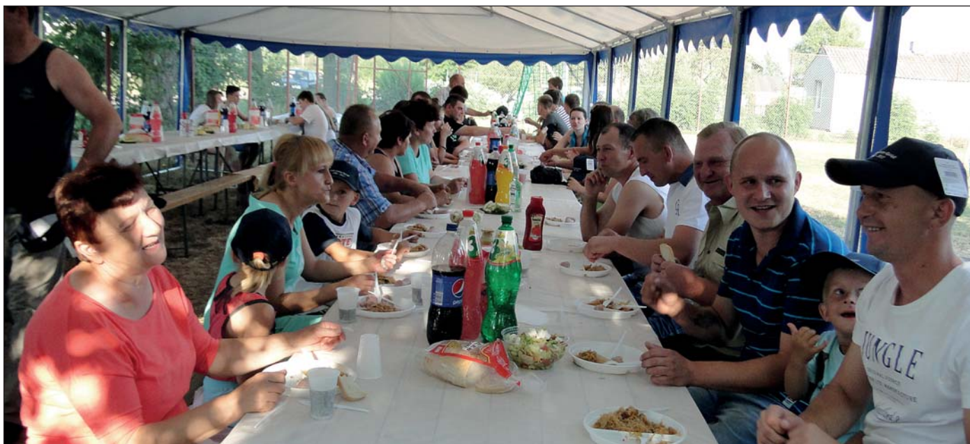
Sierakowianie zasiedli za stołami pod namiotem