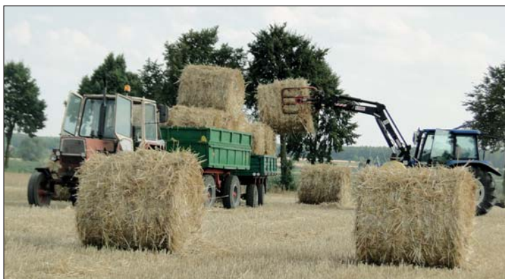
Kolejne bele słomy „wędrują” na przyczepę