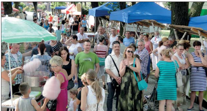
Przez dwa dni imprezy, 19 i 20 lipca, „mamy” park w Raciążu, gdzie odbywał się jarmark, odwiedziło wielu mieszkańców miasta i gminy