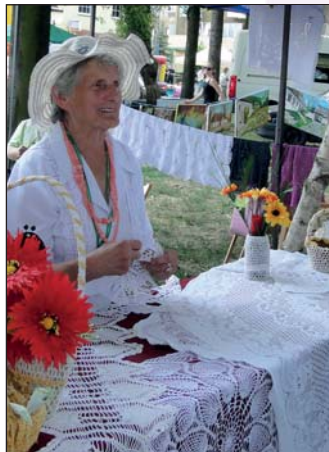
Nie ma to jak koronkowa robota