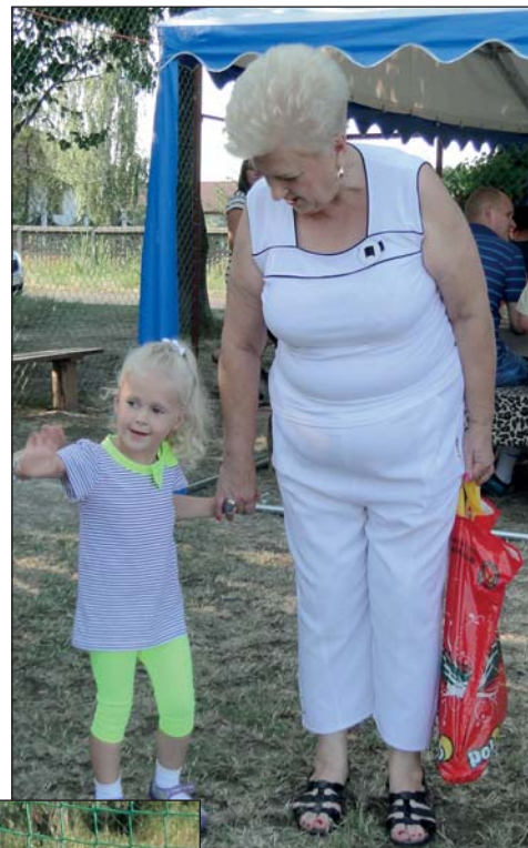
W grillowaniu w Sierakowie uczestniczyły różne pokolenia mieszkańców