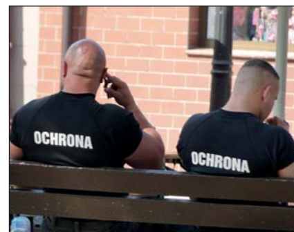
Ochroniarze gotowi do reakcji