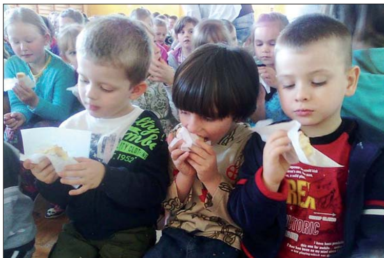
Po programie artystycznym z apetytem pałaszowały kremówki