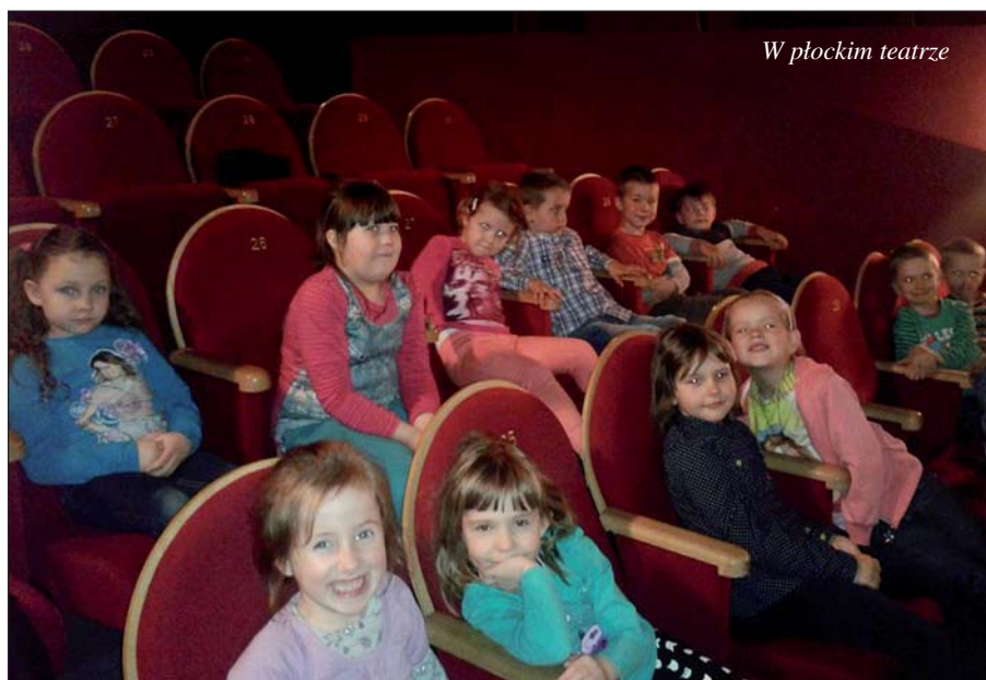
W płockim teatrze