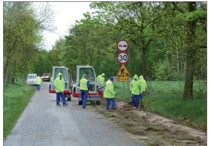
Układanie światłowodu w gminie Raciąż, dzięki czemu każdy mieszkaniec gminy uzyska dostęp do internetu