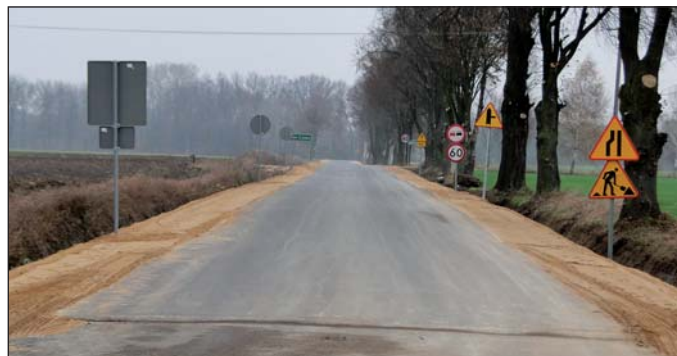
Jedną z ostatnich inwestycji drogowych w gminie Raciąż, wykonanych przez powiat płoński, była przebudowa traktu do Galewa z budową mostu na Rokitnicy

nemu Ptasikowi, że chodnik przy drodze powiatowej od szkoły Koziebrodach do drogi do Małej Wsi jest konieczny ze względu na bezpieczeństwo dzieci. Jednak w pierwszej kolejności wykonywane są te inwestycje drogowe, gdzie – jak powiedział – istnieje zagrożenie nieprzejezdności dróg. W sprawie modernizacji drogi Galewo – Drobin starosta stwierdził, że powiat płoński musi się w tej kwestii porozumieć z gminą Drobin.