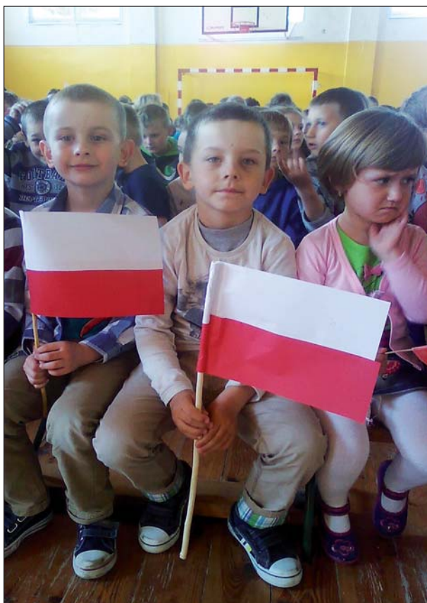
Dzieci uczestniczyły w akademii z okazji rocznicy uchwalenia Konstytucji 3 Maja