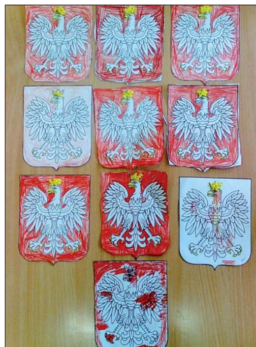
Prace dzieci z OEP w Starym Gralewie