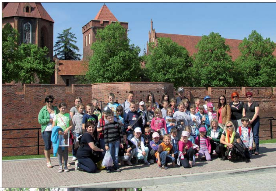
Przed zamkiem w Malborku

Swoją wizytę rozpoczęliśmy od zwiedzania z przewodnikiem muzeum na zamku krzyżackim. Następnie przemieściliśmy się do Dino Parku, gdzie po smacznym posiłku wyruszyliśmy na ścieżkę edukacyjną, na której witały nas ruchome dinozaury, które w otoczeniu pięknej zieleni lasu przeprowadziły nas przez poszczególne okresy w dziejach Ziemi. Na ścieżce dydaktycznej zobaczyliśmy, jak wyglądały setki milionów lat temu. Dzieci były za-