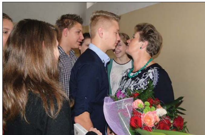
Życzenia, kwiaty i całus dla wychowawczynie były tego dnia obowiązkowe