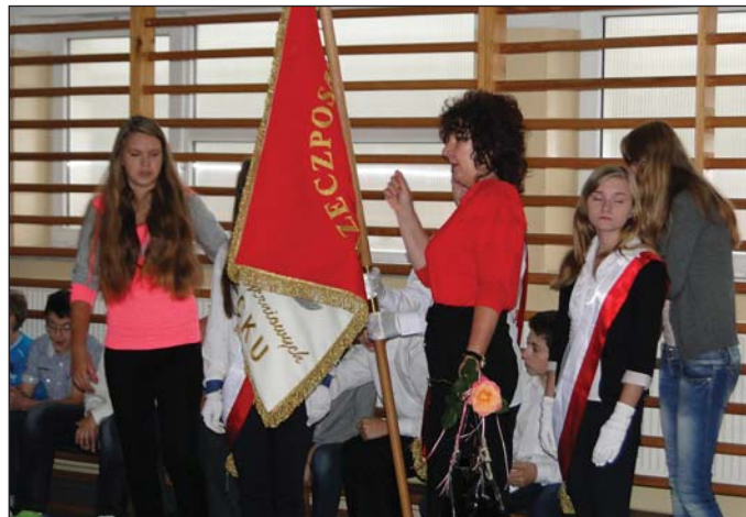
Ostatnie uwagi dla poczty sztandarowego i...