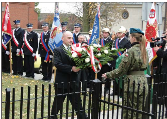
Wójt gminy Ryszard Giszczak