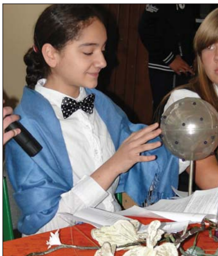
W programie artystycznym zaprezentowanym przez gimnazjalistów z kl. I wystąpiła wróżka, która przepowiadała uczniom przyszłość w nowej szkole