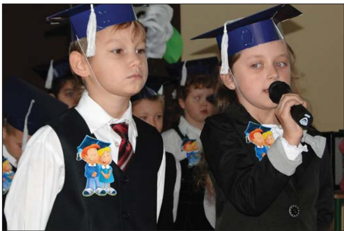
Pierwszoklasiści, nim złożyli ślubowanie, śpiewali i recytowali wierszyki