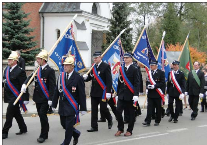
Po mszy uczestnicy uroczystości przeszli pod pomnik

hitlerowskiej. Mówił o ofiarach niemieckiego terroru, o tych powieszonych w Gralewie, i innych, którzy ponieśli śmierć w latach 1939-45. – O tych ludziach powinniśmy mówić, o nich powinniśmy pamiętać, im winniśmy stawiać pomniki – stwierdził.