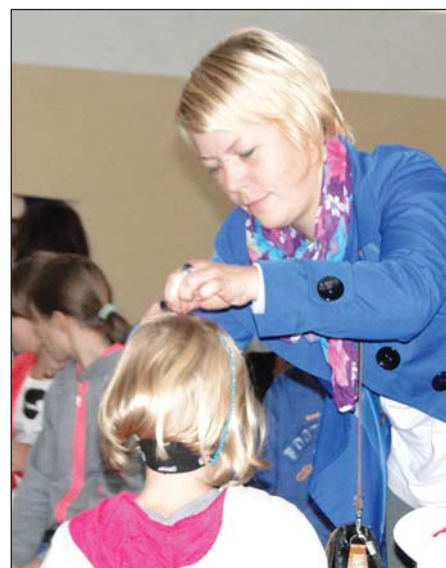
... poprawa uczesania pociechy