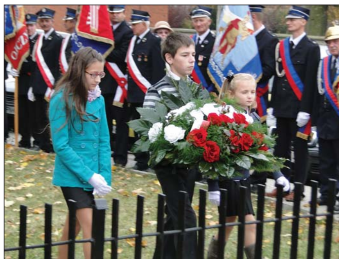
Kwiaty składają uczniowie szkoły w Gralewie