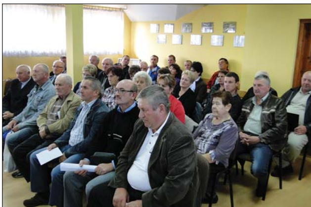
Wśród gości na sesji dominują sołtysi

tań na sesji niczym bumerang. Stanowisko władz gminy w tej sprawie jest jednoznaczne: nie będzie wykaszania poboczy przy drogach żwirowych przy użyciu wykaszarki, jedynie ręcznie. Powód jest prosty – już pierwszego dnia użycia do tego celu nowego sprzętu, zakupionego przez