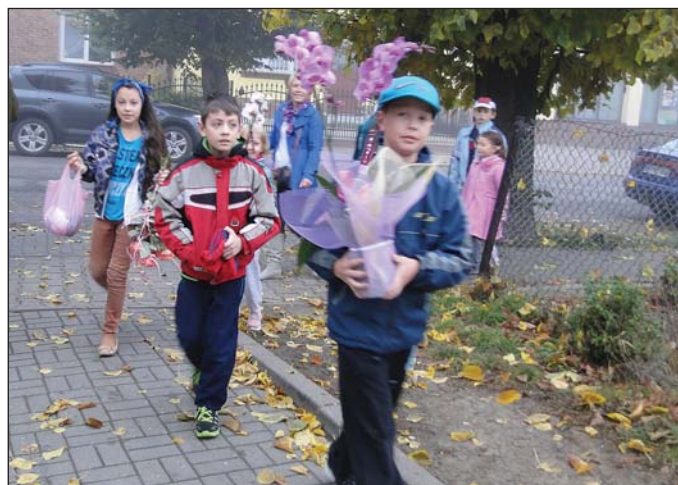
Uczniowie szli do szkoły w kwiatami

Podczas uroczystości nie mogło zabraknąć życzeń dla nauczycieli