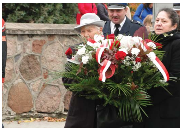
Delegacja związku kombatantów