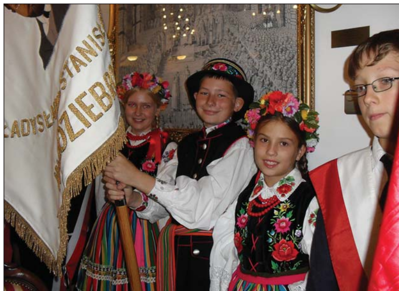
Poczet sztandarowy szkoły w Koziębrodach