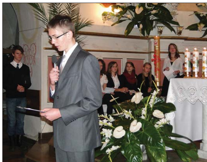
Młodzież przestawiła poezję patriotyczną