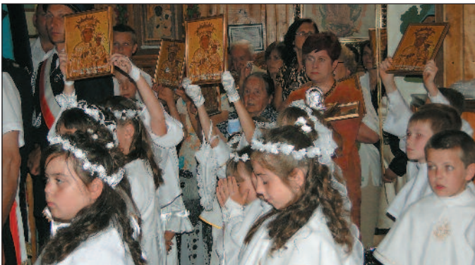
W czasie nabożeństwa biskup poświęcił obrazki z reprodukcją obrazu Matki Boskiej, znajdującego się w ołtarzu głównym kościoła