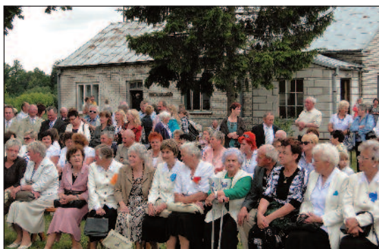
Zebrali się sporo publiczności