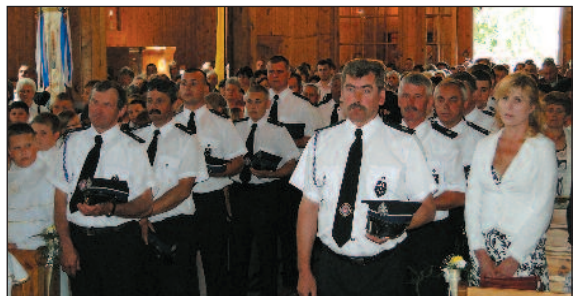
Na nabożeństwie w zwanym szyku stawili się strażacy

wiązał do przypadającego tego dnia święta – Zesłania Ducha Świętego, zwanego potocznie Zielonymi Świątkami, a także do rocznic budowy i konsekracji kościoła w Uniecku.