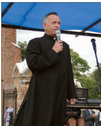
Ksiądz proboszcz był rad z frekwencji i na początek zapowiedział aktorów