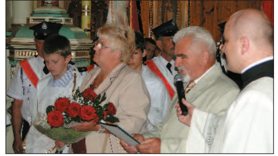
Biskupa witali parafianie...