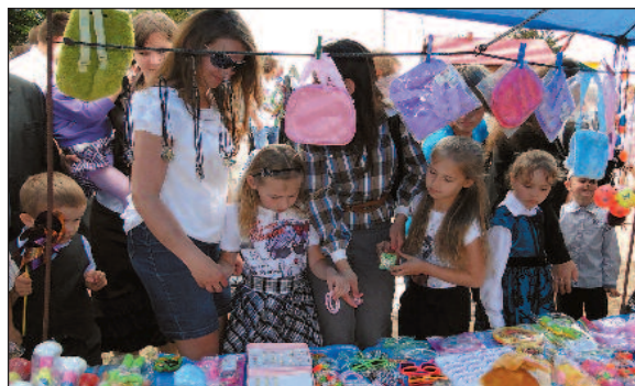
... penetrowały odpustowe stragany