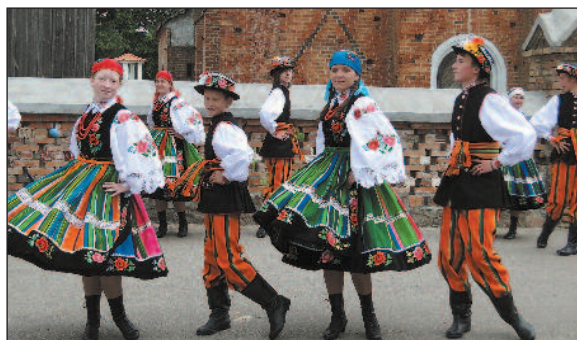
Młodzież w ludowym tańcu i ludowych strojach zakupionych przez gminę