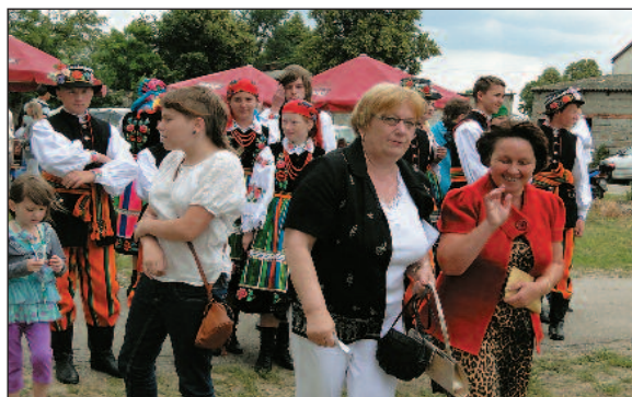
Opiekunki szkolnego zespołu tanecznego już po ostatniej rozmowie z młodzieżą przed występem