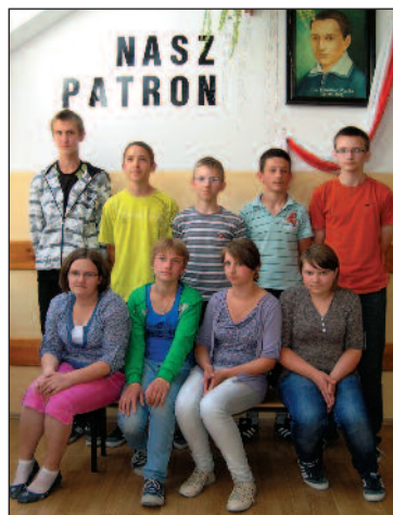
I Lokalny Zespół projektowy

W minionym roku szkolnym klasa pierwsza realizowała dwa projekty: „Zdrowi – nie tylko duchem” oraz „Świadomość ekologiczna kluczem do sukcesu”. Każdy zespół projektowy składał się z 12 uczniów. Opiekunami działań projek-