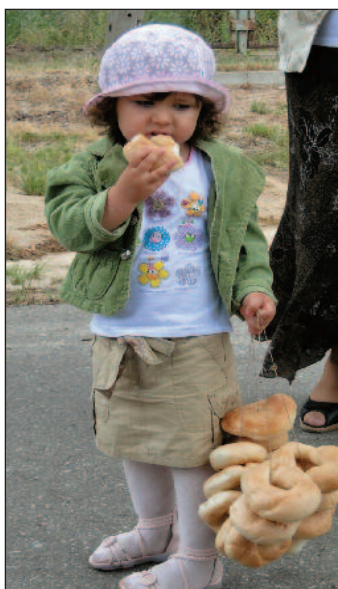
Dzieci najchętniej pałaszowały obwarzanki i...