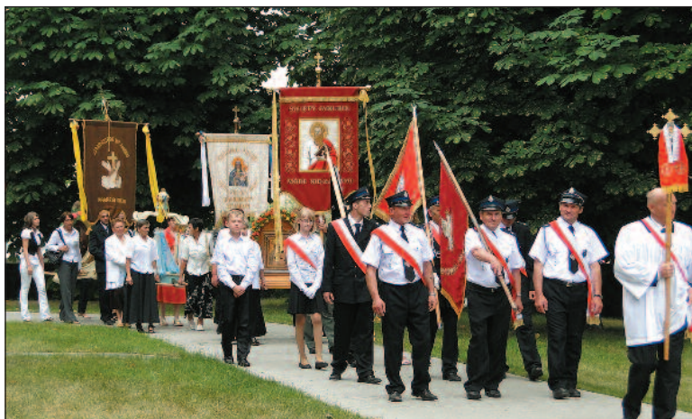
Procesja wokół kościoła