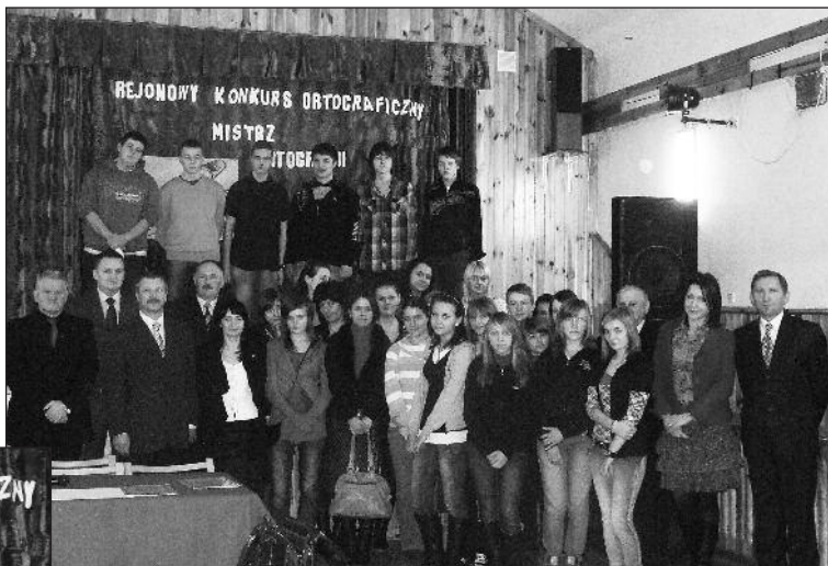
Uczestnicy i organizatorzy dyktanda