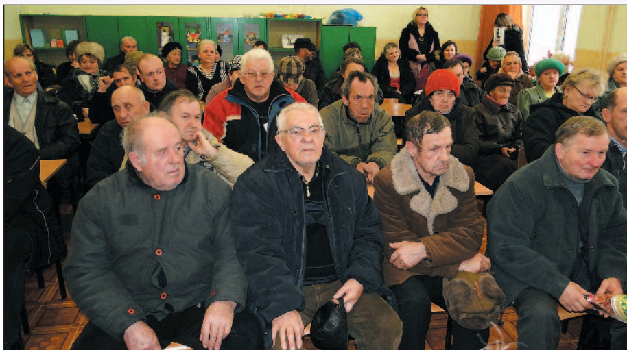
Na zebranie przyszło ok. 60 mieszkańców wsi

dek jordanowski, który mieszkańcy postanowili urządzić w Koziebrodach ze środków z tegorocznego funduszu sołectkiego, zostanie zlokalizowany przy szko-