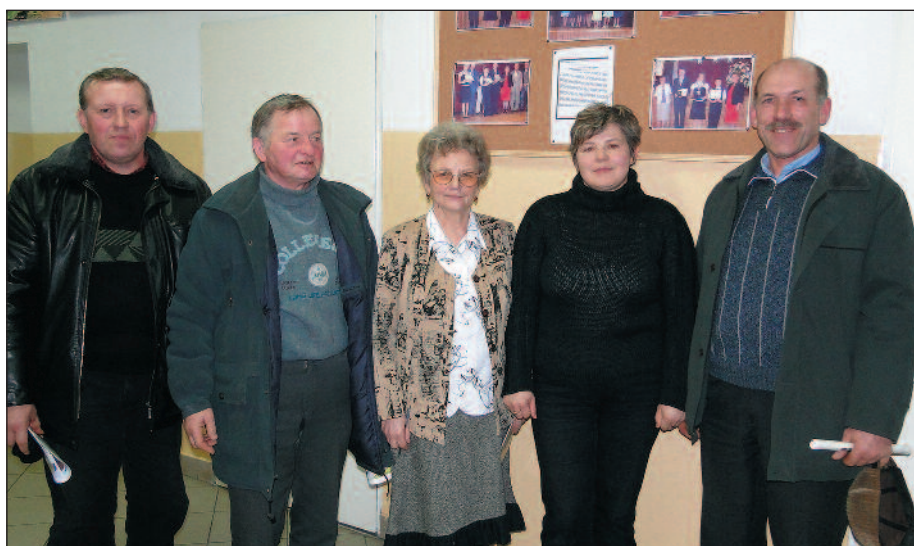
Nowo wybrany sołtys i rada sołectka w Koziebrodach

W kolejnym numerze „Głosu Raciąży” zamieścimy nazwiska wszystkich nowo wybranych sołtysów w gminie Raciąż.