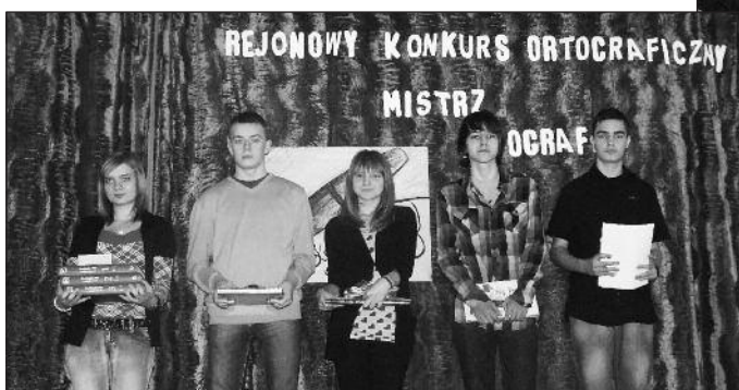
Laureaci konkursu ortograficznego

Tym razem na uczniów czekały niewinnie wyglądające pułapki ortograficzne w postaci łącznej i rozłącznej pisowni wyrazów. Już pierwsze dwa zdania nastroczały trudności – „Dokąd by jechać? Niech no by ktoś doradził.”. Hipochondryczni bohaterowie naszego dyktanda hołubiący swe marzenia o podróży do kraju Niccolò Machiavelliego, których prześladowały erynie i bachantki, także nie należeli do najłatwiejszego towarzystwa. Uczniowie gimnazjów z Raciąża, Krajkowa, Gralewa, Uniecka i Koziębrod stanęli jednak na wysokości zadania, a wyniki prezentują się następująco: