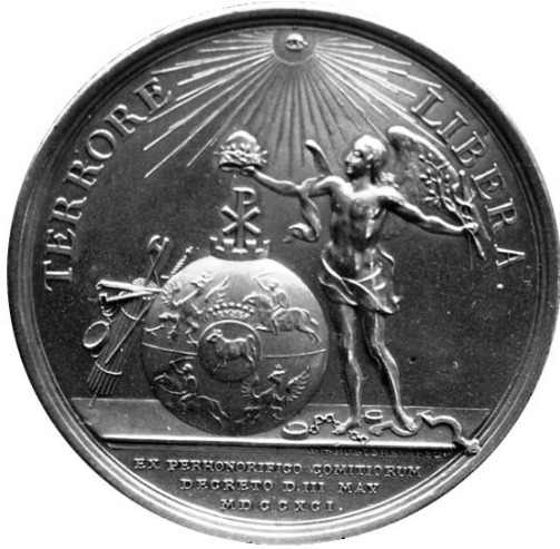
Medal wybitny w 1791 z okazji uchwalenia Konstytucji 3 Maja

sła kilka instytucjonalnych źródeł słabości rządu i anarchii – m.in. liberum veto, konfederacje, skonfederowane sejmy oraz nadmierny wpływ sejmików ziemskich wynikający z wiążącej natury instrukcji nadawanych przedstawicielom do sejmku. Obowiązywała tylko przez rok, zanim została obalona przez konfederację targowicką wraz z armią rosyjską w wyniku wojny polsko-rosyjskiej 1792.