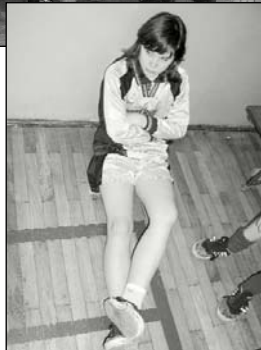
Martyna Morawska - ulubienica publiczności