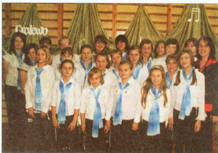
Schola z Koziębród