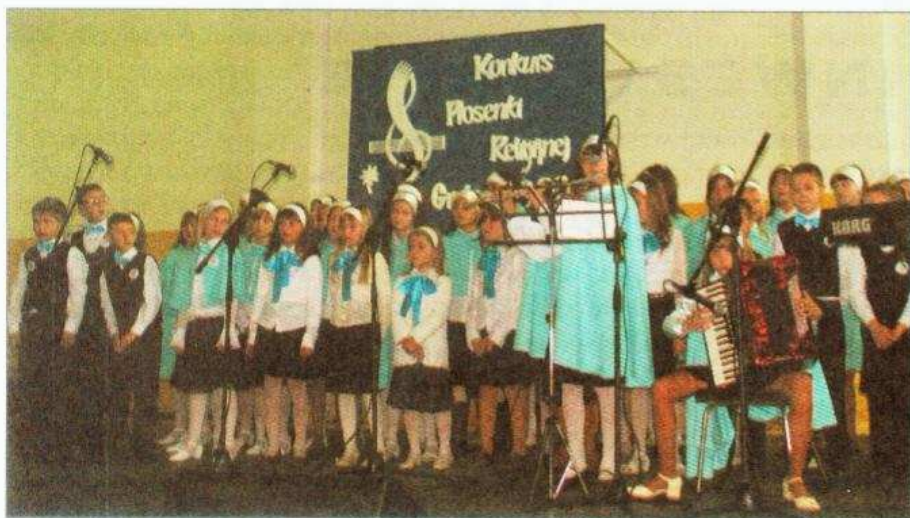
I miejsce w kategorii scholi zajęły „Peretki” z Baboszewa