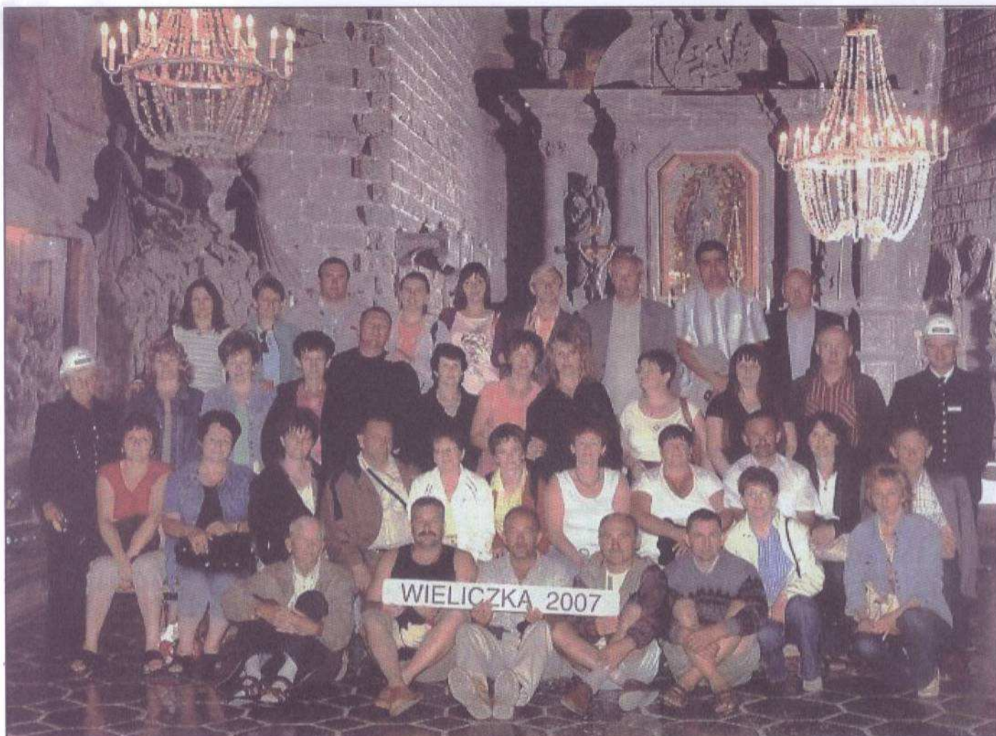
W tym roku samorządowcy z gminy Raciąż wybrali się na wycieczkę na południe Polski, w okolice Krakowa, Zakopanego. Byli też na Słowacji. Na zdjęciu - w kopalni soli w Wieliczce.