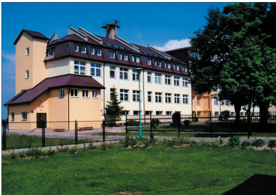
W gminie Raciąż najwięcej uczniów uczęszcza do szkół w Gralewie

Gmina Raciąż otrzymała zaproszenie do wzięcia udziału w pilotażowym programie pod nazwą „Uczeń na wsi – pomoc w zdobyciu wykształcenia przez osoby niepełnosprawne za-