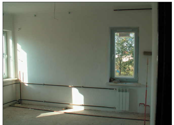
250 tys. zł kosztował będzie gminę remont budynku wewnątrz