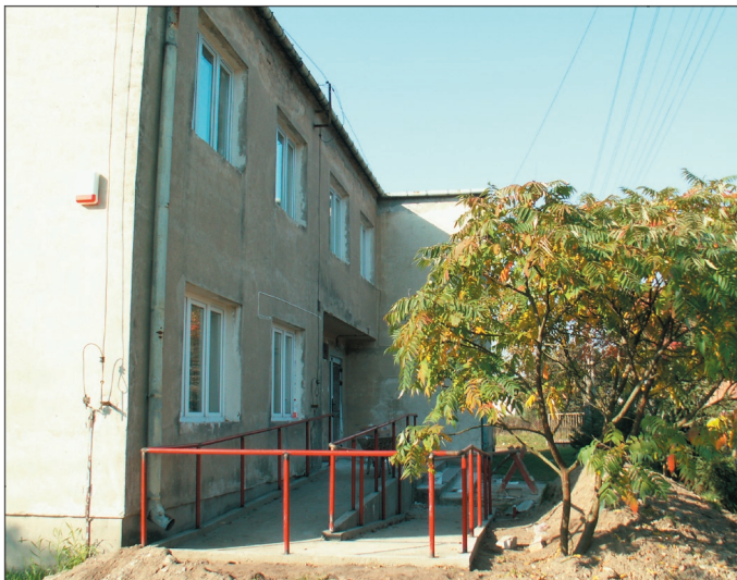
Dla osób na wózkach wykonany został podjazd do budynku

-Wszystko wskazuje na to, że modernizacja budynku wewnątrz zostanie zakończona jeszcze w tym roku – mówi wójt