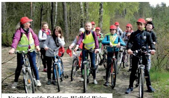
Na trasie rajdu Szlakiem Wielkiej Wojny