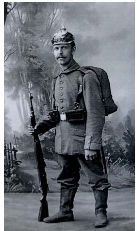
Ilustracje ze zbiorów Grzegorza Domańskiego

Wielka Wojna nieodwracalnie zmieniła polityczne oblicze Europy i świata. Zakończyła okres globalnej dominacji europejskiej. Upadło jedno z największych mocarstw – Austro-Węgry, carska Rosja w wyniku rewolucji przekształcała się w totalitarny Związek Radziecki, a na mapie świata pojawiły się nowe państwa oraz kraje, które po latach niewoli odzyskały niepodległość, wśród nich Polska.