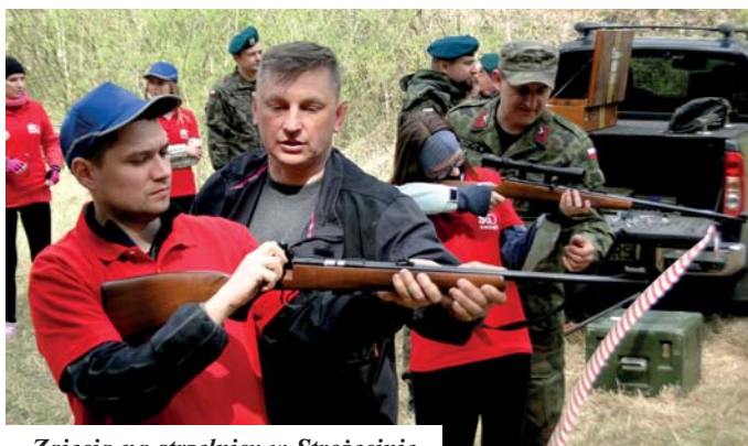
Zajęcia na strzelnicy w Strożęcinie