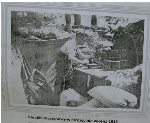
Karabin maszynowy w Strojcinie wiosna 1915