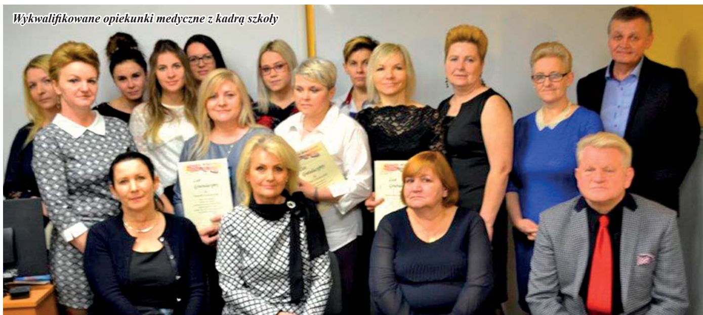
Wykwalifikowane opiekunki medyczne z kadrą szkoły