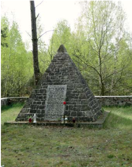
Pomnik w formie piramidy zbudowanej z kamieni

W gminie Raciąż w lesie między Pęsamami a Drozdowem znajduje się cmentarz wojskowy z okresu I wojny światowej, który powstał w latach 1916-1918, kiedy Mazowsze było okupowane przez Niemców. W jego centralnej części znajduje