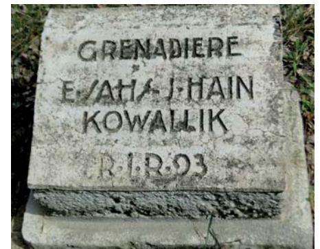
Na mogiłach żołnierzy armii niemieckiej znajdują się także polskie nazwiska

Warto wiedzieć, że w czasie I wojny światowej przez Pęsy przetoczył się front podczas operacji przasnyskich, w trakcie których oddziały niemieckie atakowały Rosjan od strony Prus Wschodnich. Celem było zdobycie Przasnysza i otwarcie drogi do linii Narwi chronionej przez twierdze Różan i Modlin oraz znajdujące się między nimi przedmoście w Pułtusk. Pęsy znalazły się na linii frontu od 15 do 18 lutego 1915 r. oraz w czasie ofensywy lipcowej w 1915 r.