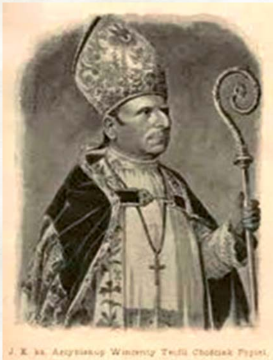
Wincenty Teofil Popiel-Chościak 21.07.1825 – 7.12.1912

Narodowy zryw powstańczy w 1863 r. odbił się szerokim echem nie tylko w Królestwie Polskim, ale także na Litwie i Białorusi. Wzięły w nim udział wszystkie warstwy społeczne Polaków. Do tego niezwykłego zrywu włączyło się także duchowieństwo katolickie diecezjalne i zakonne. W diecezji płockiej około 180 duchownych za swoją działalność patriotyczną i narodową w różny sposób było represjonowanych. Wielu z nich skazanych było na katorgi syberyjskie, osiedlenie w odległych regionach cesarstwa, więzienie i inwigilację. Także duchowieństwo zakonne doznało represji, zwłaszcza przez kasatę wielu klasztorów. Wszystko to utrudniało realizowanie misji Kościoła, choć nie złamało woli i ducha w walce o prawa Kościoła i Narodu. Najbardziej dokuczliwe dla Kościoła diecezji płockiej były lata rządów biskupa płockiego Wincentego Chościak-Popiela w latach 1863-1868, którego poglądy w sprawie powstania były nie chętne, a nawet wrogie. Potępiał surowo nie tylko powstańców, ale również kler płocki, który w większości nie słuchał w tym względzie swojego biskupa, biorąc czynny udział w powstaniu.