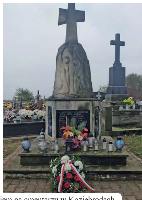
Wieniec złożono także pod pomnikiem na cmentarzu w Koziebrodach.